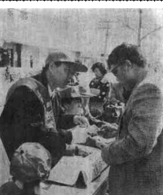
4月1日上午，市人民银行组织全市金融系统的干部职工走向街头，向社会各界人士广泛宣传《中国人民银行法》。据统计，这次活动，有500余名金融系统的干部职工参加，接待咨询群众近千人，动用宣传车6台，设立了20个宣传咨询站，散发传单3万份，引起了社会各界对《中国人民银行法》这部金融大法的关注，为《中国人民银行法》的顺利实施奠定了良好基础。 (图一)市人大副主任张希芝(左二)、市人民银行行长王英民(左三)走上街头参加宣传活动。 (图二)金融系统干部职工向过路群众散发宣传材料。 (图三)市人民银行工作人员在向群众介绍反假币知识。

学好弄懂《中国人民银行法》条文是保障顺利实施中央银行法的前提和基础。各级人民银行和金融机构的领导要率先垂范，带头学法，并认真组织好本单位、本系统干部职工的学习活动。同时，要采取多种形式向社会各界，特别是地方党政部门和经济管理干部，广泛宣传《中国人民银行法》，以取得社会各界的理解和支持。各级有关部门工作人员也要认真学习领会《中国人民银行法》，用法律观念指导工作。通过学法要做到守法、执好法，对违反这部法律的行为，不管它是出自哪个地方，哪个机构、哪个人，是内部还外部，都要以事实为根据，以《中国人民银行法》为准绳，铁面无私地追究当事人的法律责任，对于触犯刑律的要追究刑事责任，共同造就一个良好的金融法制环境，抑制通货膨胀，稳定币值，保障整个经济、金融改革和发展健康有序地进行。